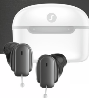
Insignia Charge&Go IX